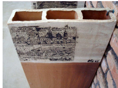
1 - Proyecto Sur.