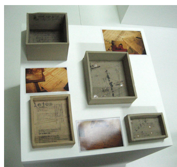
1- Biocartografías .